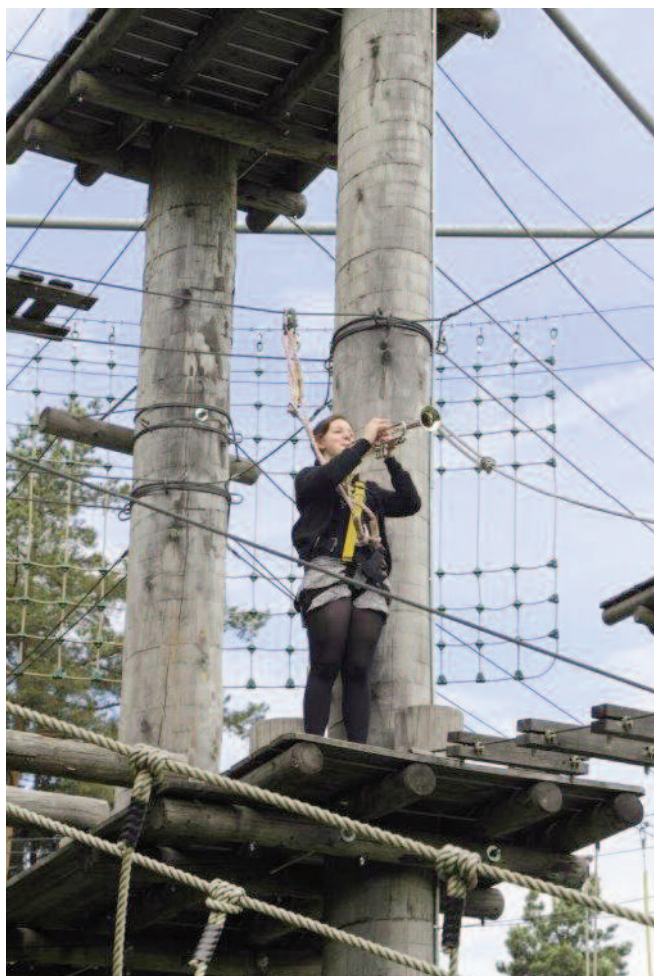
Die Proben zum World-Music-Event haben begonnen