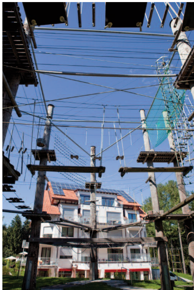
Kinik Wollmarshöhe mit Hochseilgarten